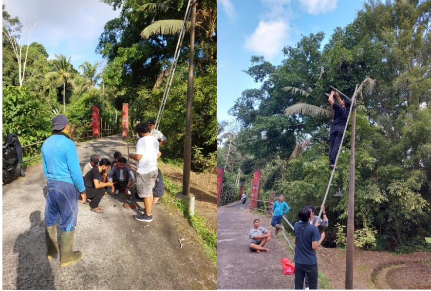
Gambar 1.1 .Kegiatan Perbaikan Lampu jalan